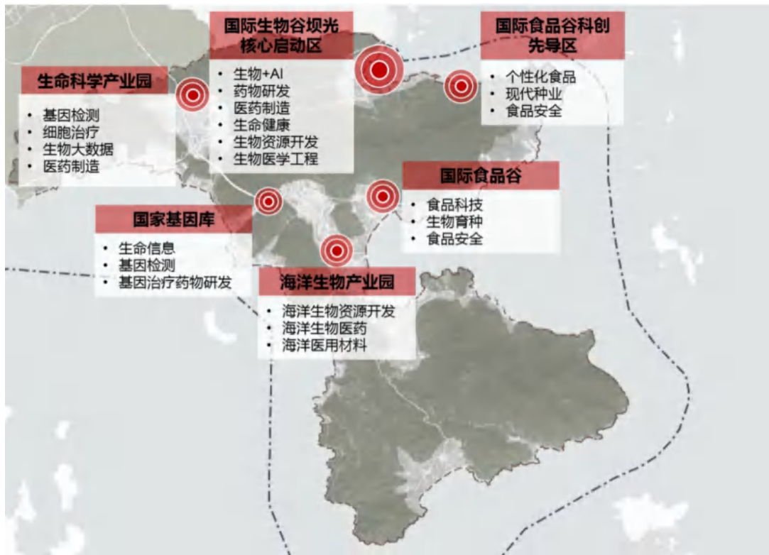
图 2 生物医药“一库两谷两园”空间分布图