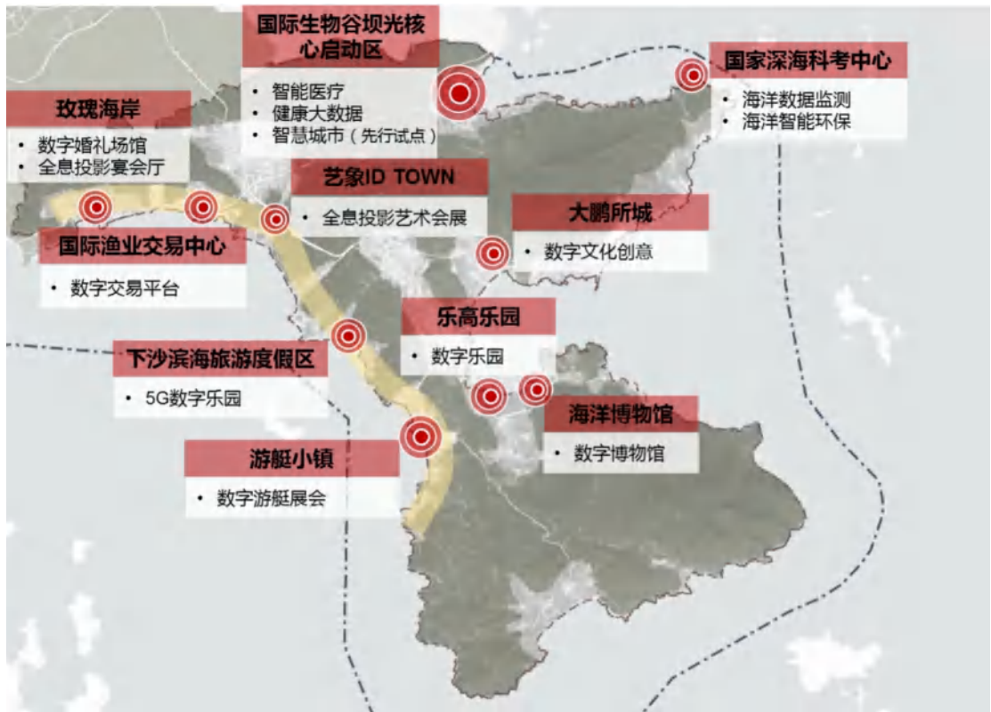
图 4 数字经济“一湾多节点”空间分布图