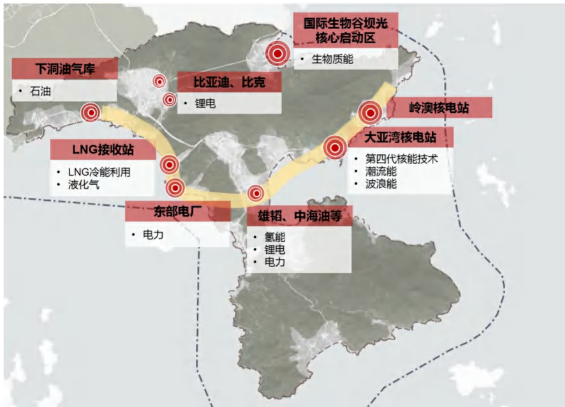
图 3 绿色能源“一带多园”空间分布图